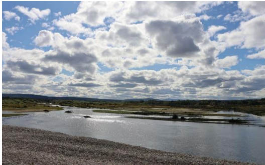
An der Mündung des Spey

Glen Grant vergärt sein Wash (also die Vorstufe vom Bier) 48h lang in 10 Washbacks aus Oregon Pine, bevor die Destillation beginnt. Glaubt man Diageo, sollten wir zart getreidig bis nussige Brände im Glas haben.