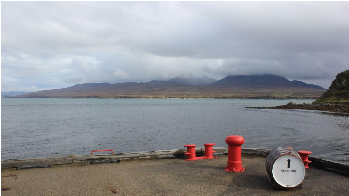
Kenner wissen, sieht zwar aus wie bei Caol Ila, ist aber Bunnahabhain

Caol Ila steht aber auch irgendwie sinnbildlich (nicht beispielhaft!) für den Untergang der Whiskyindustrie in den 20ern in Campbeltown und eben darüber hinaus, denn Caol Ila war ebenfalls bis 1937 stillgelegt (seit Mitte/Ende des 19. Jahrhunderts, warum auch immer). Damit wären wir aber noch einmal bei Glen Scotia, noch ein Wort dazu: Als West Highland Malts Distillers im Zuge des beinahe vollständigen Zusammenbruchs der Whisky-Industrie in Campbeltown bankrott gingen, riss das nicht nur die beiden heute noch bekannten Namen Glen Scotia, Glengyle, Longrow und Hazelburn in den Abgrund, sondern auch noch nicht mehr so bekannte Namen wie Dalintober, Kinloch und Ardlussa.