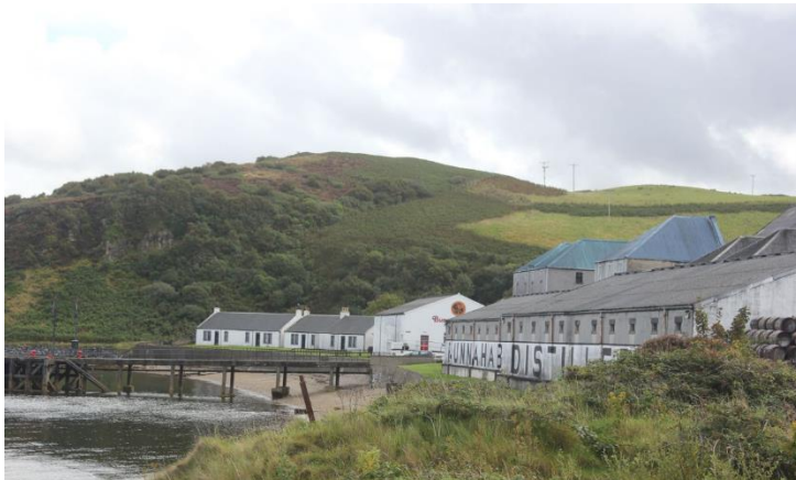
Bunnahabhain, diesmal wirklich

Glen Scotia heute, das ist eine Vielzahl von - sagen wir spannenden Abfüllungen,