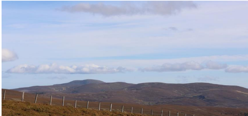
Willkommen im nichts!

Es gibt in Schottland einsame Gegenden, es gibt sehr einsame Gegenden, und dann gibt's diese eine Gegend östlich der Cairngorms, rund um Tomintoul. Und just dort wurde die Braeval-Distillery errichtet, 1973 als Braes of Glenlivet, und als höchstgelegene Distillery Schottlands. Die Gründerväter waren Brüder, die Chivas Brothers, ihrerseits zu jener Zeit Sohnmänner von Herrn Seagram, bürgerlich Bronfman. Man kann also sagen, eine illustre Gesellschaft, und das obwohl in the middle of nowhere. Bereits 1975, also grad einmal 2 Jahre später, wurde die Distillery von 3