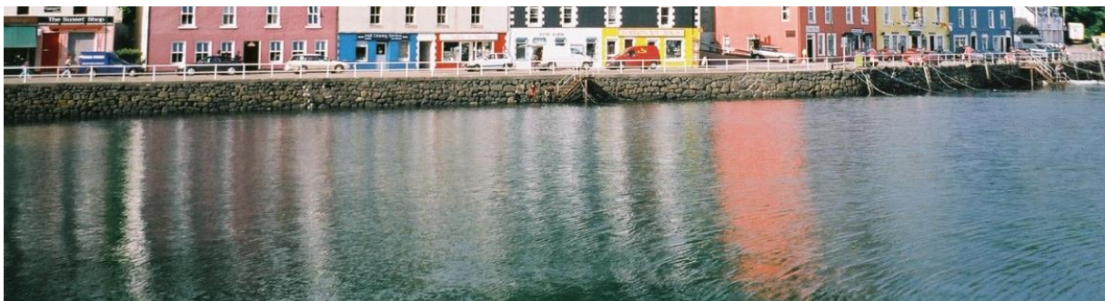
The one and only Tobermory Harbour

Kurzer Ausflug zur Isle of Mull. Wir erinnern uns, Gegründet 1798, also noch einmal 34 Jahre älter als Glen Scotia zuvor. Auch hier können sie sich nicht ent-