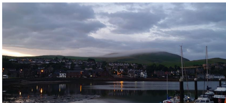
Campbeltown Harbour, Blick Richtung Glen Scotia

Glen Scotia steht quasi sinnbildlich fürs auf und ab in der Region, vermutlich wenige Distilleries können eine so reichhaltige Sammlung von (Wieder-)Eröffnungen und Schließungen aufweisen. Gegründet wurde Glen Scotia 1832, noch unter dem Namen Scotia Distillery, von Steward, Galbraith & Co. Im 19. Jahrhundert war die Welt noch in Ordnung, 1830 die Erfindung der Coffey Still, und darauffolgend der Boom, ausgelöst durch Wine- und sonstigen Merchants vor allem in Glasgow, die den Blended Whisky zu einem erschwinglichen Produkt machten, Whisky damit demokratisierten, wenn man das so nennen will.