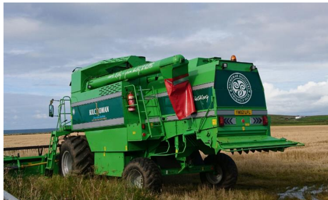
Mobile Destillation bei Kilchoman

Aber das sind zeitliche Verwerfungen, die die Herrschaften in Kilchoman aktuell grad gar nicht interessieren. Kilchoman ist derzeit in einem Status der laufenden Vergrößerung, es soll ein 3. Paar Brennblasen dazukommen, weitere 9 Washbacks zu den aktuell bestehenden 16 stählernen, und das größte Thema, auch die Malting Floors müssen mehr produzieren können, da Port Ellen Maltings seit 2022 kein gemälztes Getreide mehr an Non-Diageo-Distilleries verscherbelt.